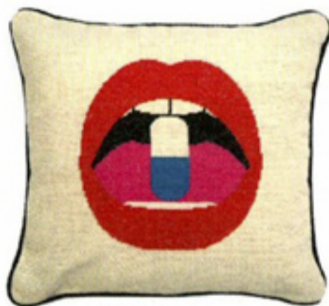
Gebreid sierkussen € 145 Jonathan Adler