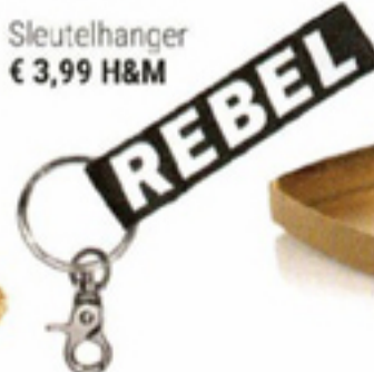
Sleutelhanger € 3,99 H&M