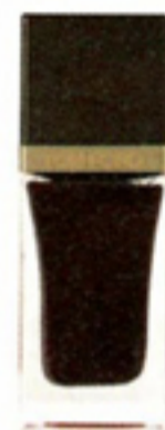
Nagellak Black Cherry € 34,50 Tom Ford Beauty