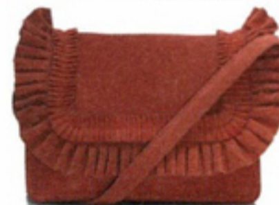
Suède schoudertas met ruches € 149 Becksöndergaard