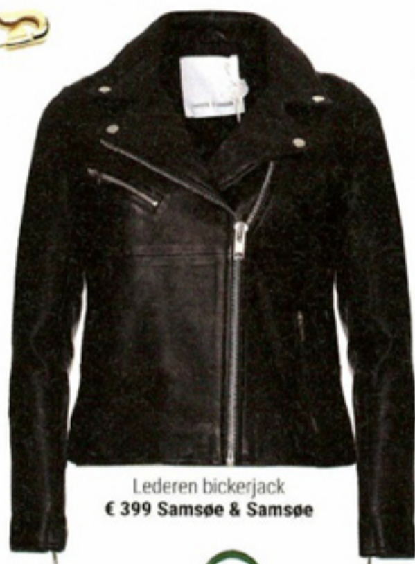
Lederen bickerjack € 399 Samsøe & Samsøe