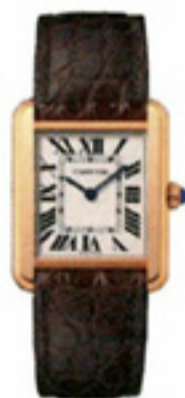
Horloge Tank Solo small van 18-karaats roségoud en krokodillenleer € 4.450 Cartier