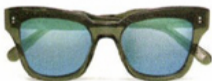
Zonnebril met spiegelglazen € 45 Chimi