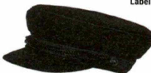
Sailorpet € 49,95 Maison Scotch