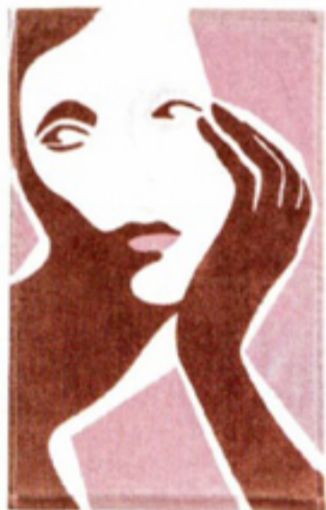
Set van twee gastendoekjes € 7,99 H&M Home