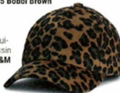
Pet met lui- paarddessin € 7,99 H&M