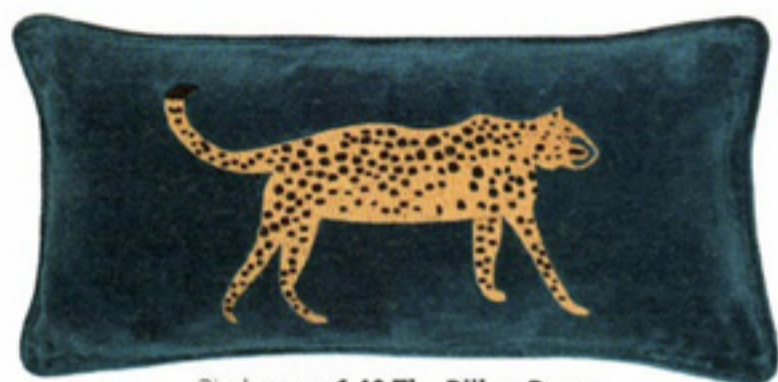
Sierkussen € 42 The Pillow Room

NOG MEER CADEAUTJES ONLINE: WENDYONLINE.NL/SHOP