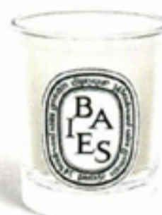
Geurkaars € 48 Diptique