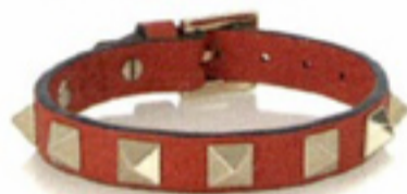
Rockstud armband van kalfsleer € 140 Valentino