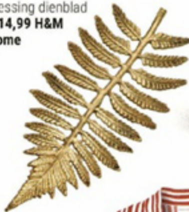
Messing dienblad € 14,99 H&M Home