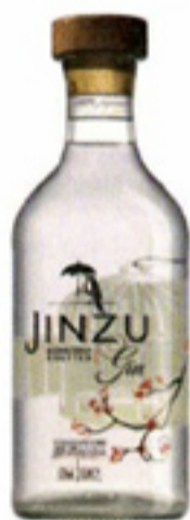
Gin € 44,99 Jinzu