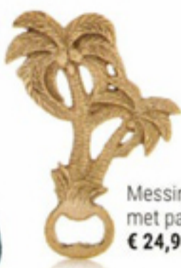
Messing opener met palmboom € 24,95 &Klevering