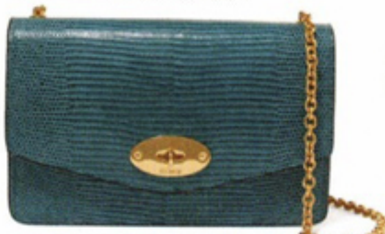
Lederen schoudertasje € 695 Mulberry