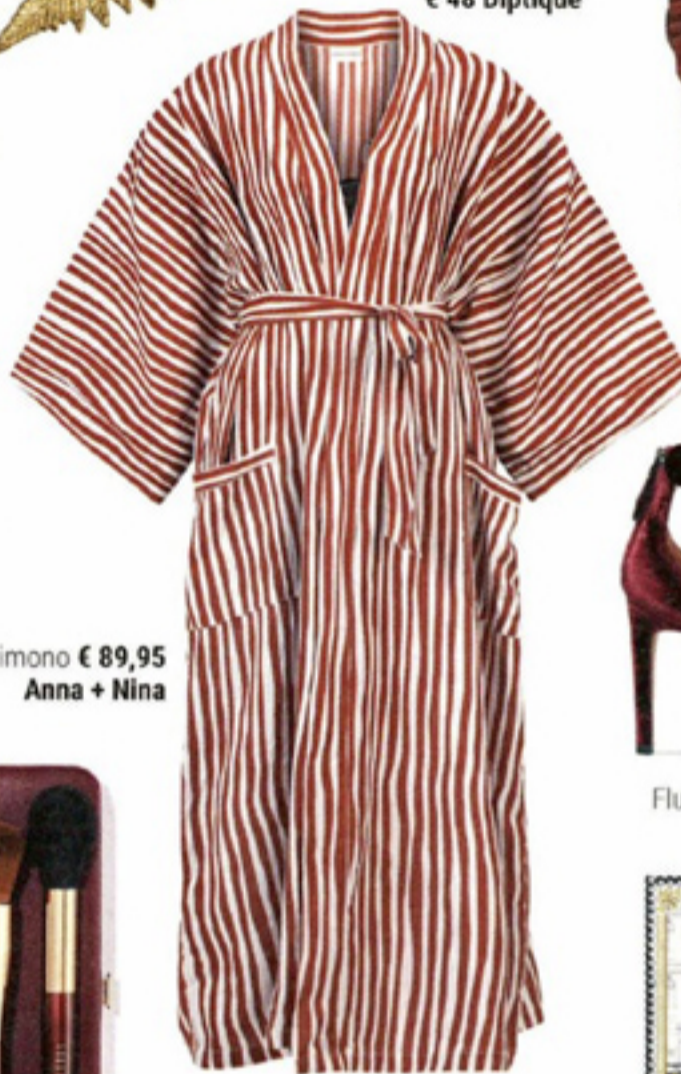
Kimono € 89,95 Anna + Nina