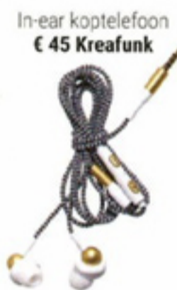
In-ear koptelefoon € 45 Kreafunk