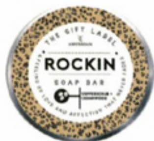
Zeep met koffiescrub en cederhout € 6,95 The Gift Label