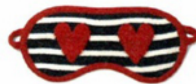
Kasjmier slaapmasker met print € 60 Chinti and Parker