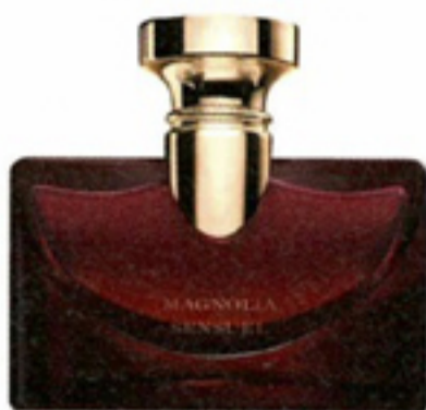
Eau de parfum Splendida Magnolia Sensuel € 45 Bvlgari