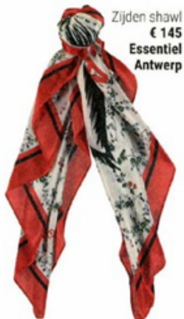
Zijden shawl € 145 Essentieel Antwerp

NOG MEER CADEAUTJES ONLINE: WENDYONLINE.NL/SHOP