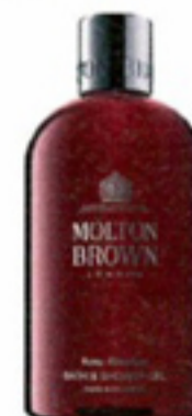
Bad- en douchegel € 22 Molton Brown