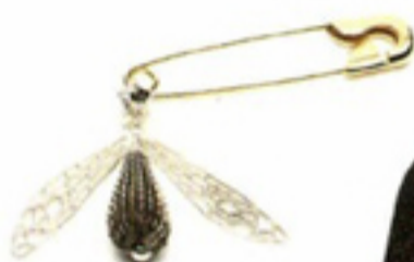
Vergulde koperen broche met zilveren hanger € 209 Wouters & Hendrix