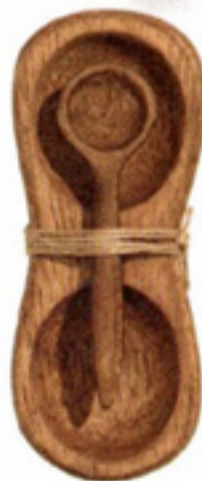
Houten peper-en-zoutstel € 9,99 H&M Home