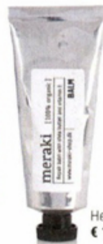
Herstellende balsem € 18,95 Meraki