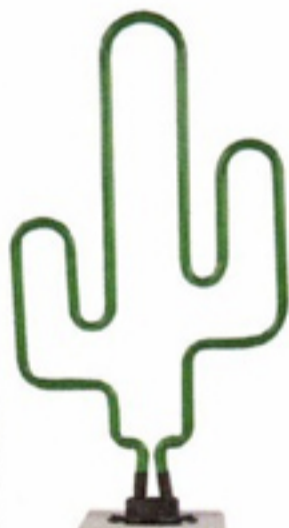
Neonlamp € 59,95 Locomocean