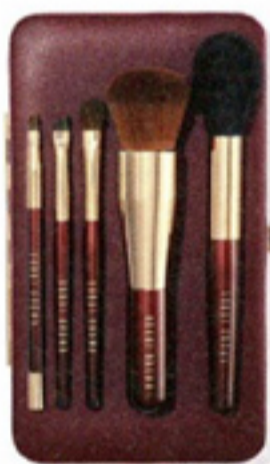
Travel-make-upwastenset € 175 Bobbi Brown