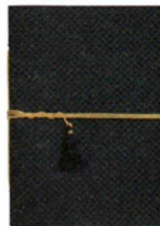
Notitieschrijftje met goudkleurige band € 9,99 Madam Stoltz