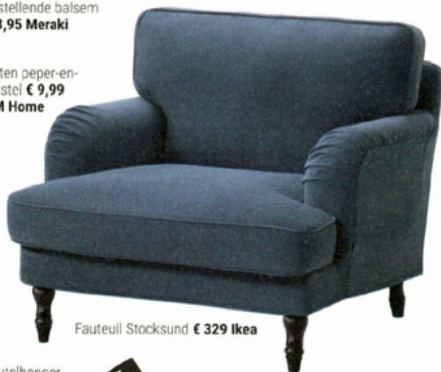
Fauteuil Stocksund € 329 Ikea