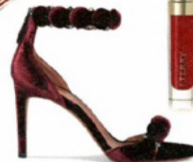
Fluwelen sandalen met studs € 880 Alaïa