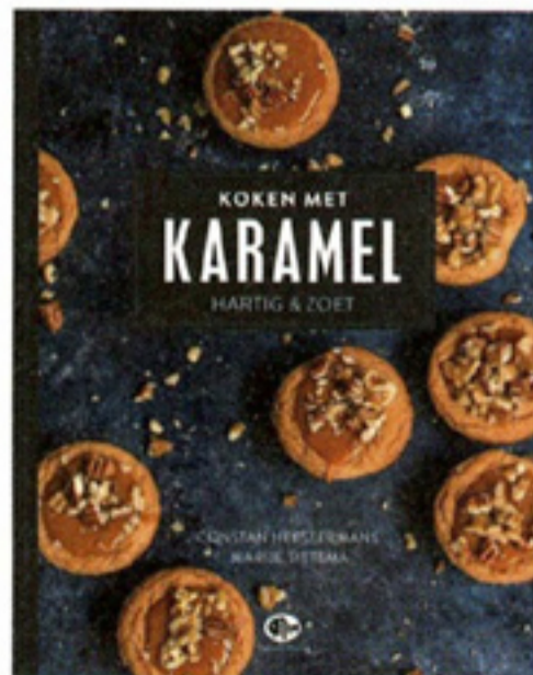
'Koken met caramel' € 17,50 Uitgeverij Loopvis