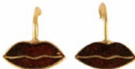
Gouden oorbellen lip € 175 5 Octobre