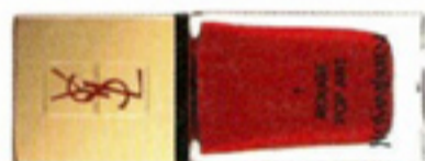
Nagellak 1 Rouge Pop Art € 27,50 Yves Saint Laurent