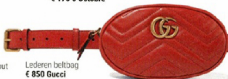
Lederen beltbag € 850 Gucci