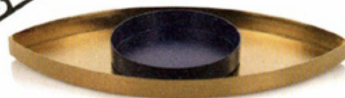
'The eye' schaalset van 2 € 35 DOIY