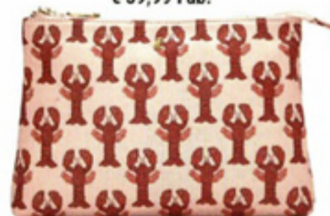
Make-uptasje met kreeftenprint € 59,99 Fab.