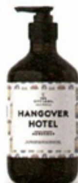
Handzeep Hangover Hotel € 9,99 The Gift Label